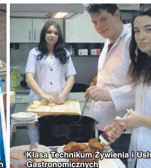
Klasa Technikum Żywienia i Usług Gastronomicznych

Zespół Szkół Centrum Kształcenia Ustawicznego w Sulejowie KSZTAŁCENIE SZYTE NA MIARĘ XXI WIEKU