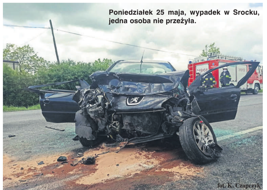
Poniedziałek 25 maja, wypadek w Srocku, jedna osoba nie przeżyła.