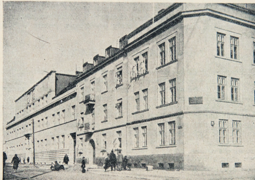
Dom czynszowy przy ul. Sulejowskiej 25. Z boku — Szkoła im. Henryka Sienkiewicza.