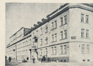
Dom czynszowy przy ul. Sułkowskiej 25. Z boku — Szkoła im. Henryka Sienkiewicza.

W dodatku oferta edukacyjna najlepszych placówek oświatowych z Piotrkowa Trybunalskiego i regionu! Z nami wybierzesz najlepszą szkołę!