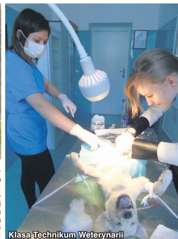
Klasa Technikum Weterynarii

specyfiki tej służby i dobrze przygotowuje do dalszego kształcenia w tym kierunku.