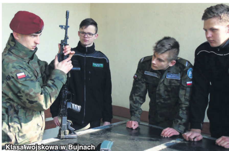
Klasa wojskowa w Bujnach

Tel. 44 616 51 23 www.zscku.czarnocin.edu.pl