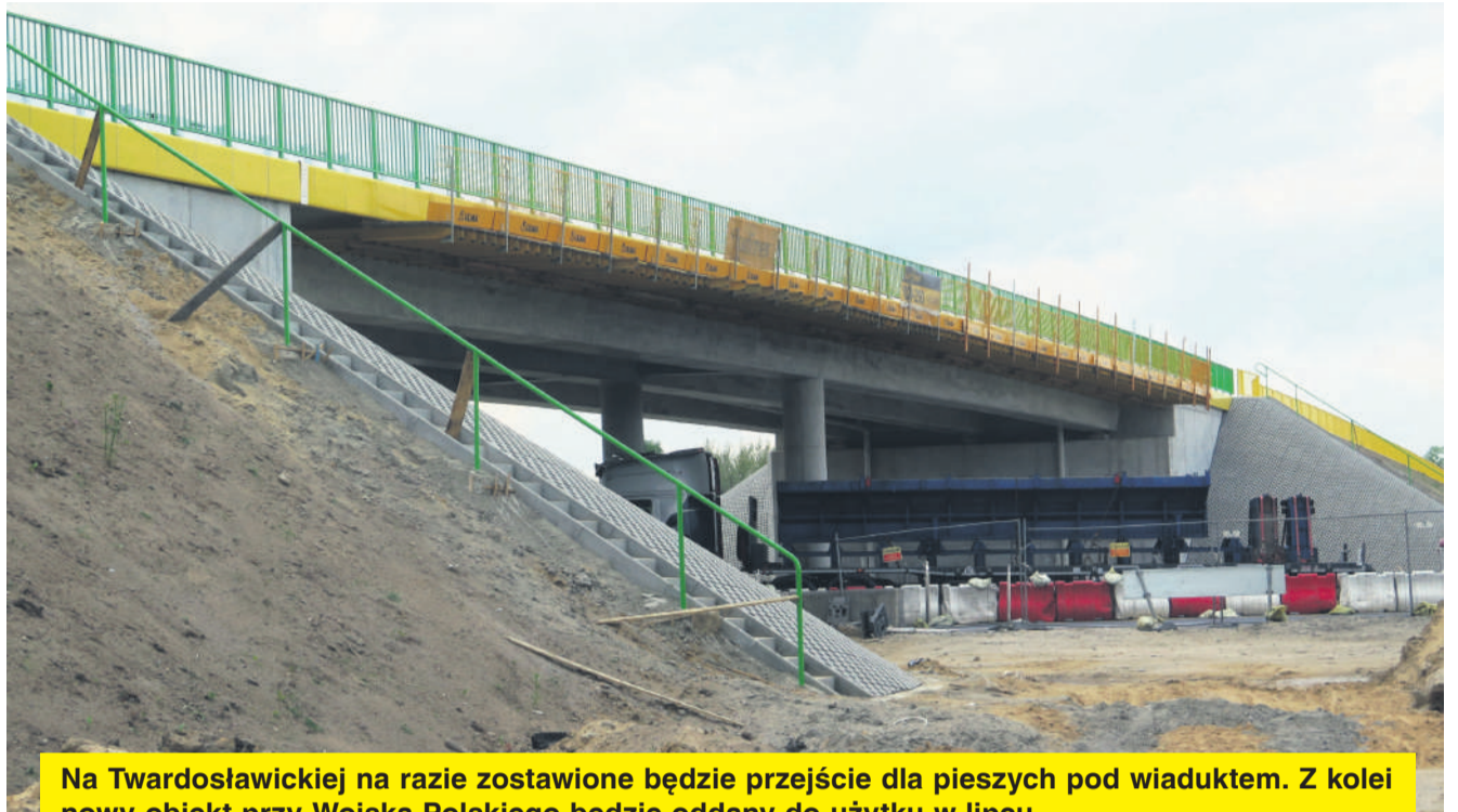
Na Twardosławickiej na razie zostanie zamknięty przejazd dla pieszych pod wiaduktem. Z kolei nowy obiekt przy Wojska Polskiego będzie oddany do użytku w lipcu.

Nadzieje związane z utworzeniem tymczasowego przejazdu przez nowy wiadukt na Wojska Polskiego szybko gasi rzecznik