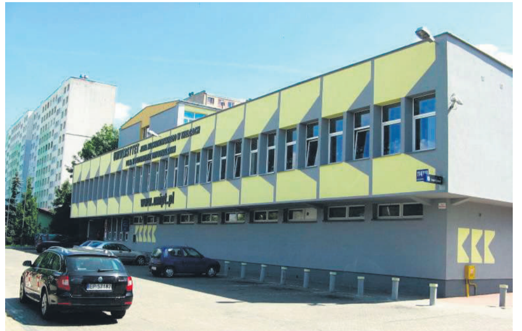
Na zdjęciu piłsudzka Filia Uniwersytetu Jana Kochanowskiego w Kielcach.

Na Warszawskim Uniwersytecie Medycznym nadal obowiązuje kwietniowe zarządzenie rektora w sprawie przeciwdziałania rozprzestrzenianiu się wirusa SARS-CoV-2 wśród członków społeczności WUM. Zgodnie z nim zawieszenie zajęć dydaktycznych kontaktowych potrwa do 30 września 2020r. "Nie mamy innych wewnętrznych regulacji zmieniających obecne zasady działania" - podkreśliła rzeczniczka prasowa uczelni Marta Wojtach. Podobnie jest w przypadku Uniwersytetu Warszawskiego. "Wszystkie te zajęcia, które od-