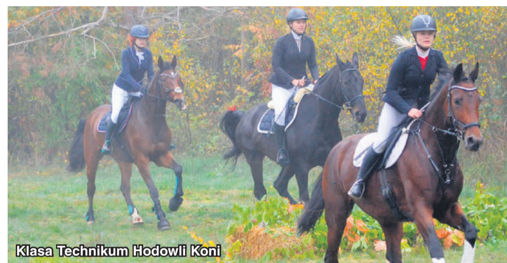
Klasa Technikum Hodowli Koni

Powiat piotrkowski to region rolniczy, a więc nie może zabraknąć kierunku technik rolnik (Bujny, Czarnocin, Szydłów) . Dziś ten