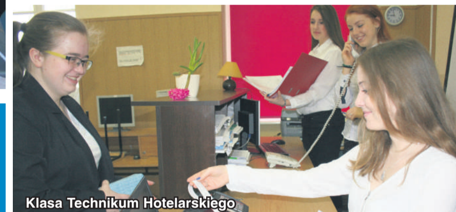
Klasa Technikum Hotelarskiego

Zespół Szkół Ponadpodstawowych Centrum Kształcenia Ustawicznego im. Władysława Stanisława Reymonta w Szydłowie