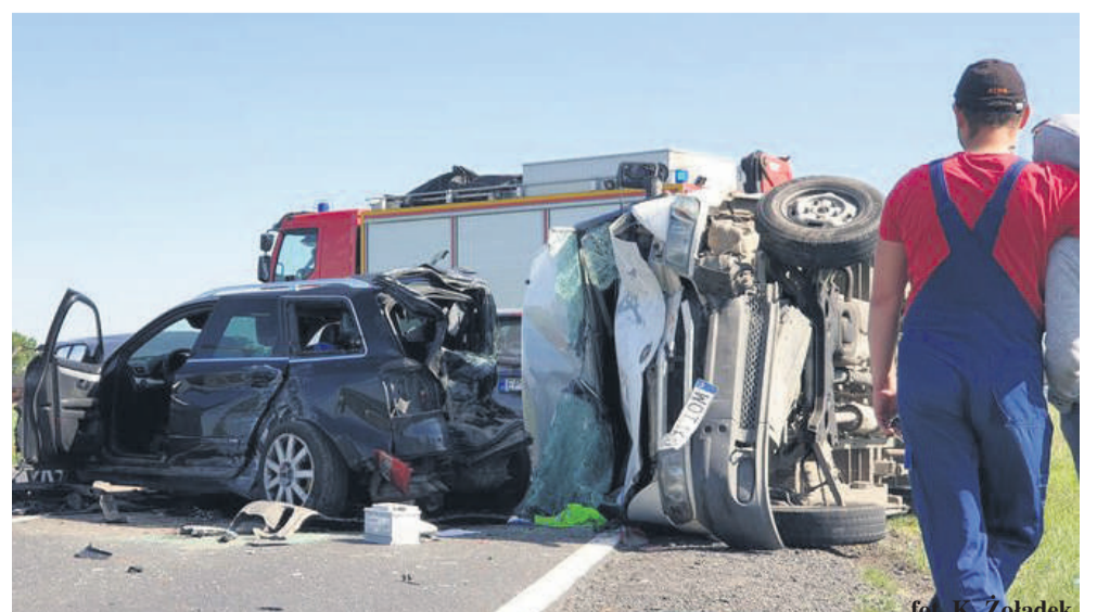
fol. K. Żołądek