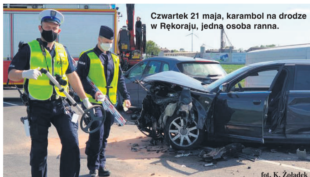
Czwartek 21 maja, karambol na drodze w Rękoraju, jedna osoba ranna.