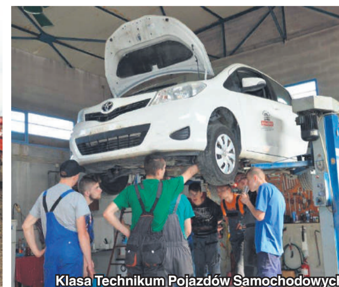
Klasa Technikum Pojazdów Samochodowych